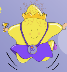
Tableau de réussite de Mathématiques